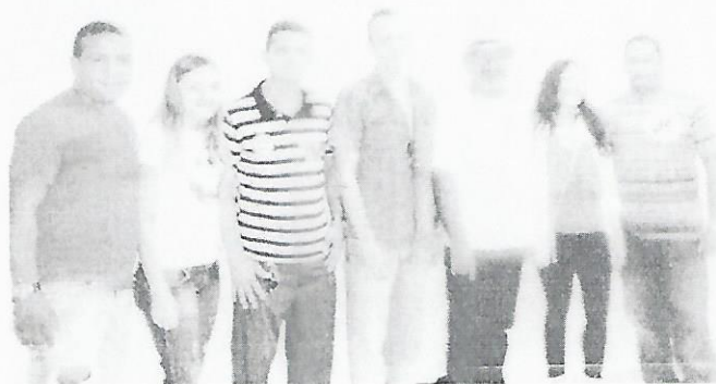
Encontro entre os integrantes do COMCIM e representante do Ministério da Cultura/Regional Norte